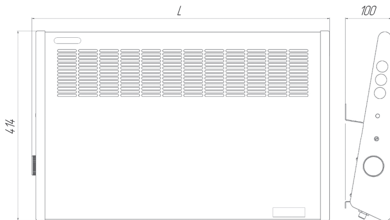
Рис.2 Габаритные размеры «Hintek» 500 (нерж ТЭН), «Hintek» 1500 (нерж ТЭН)